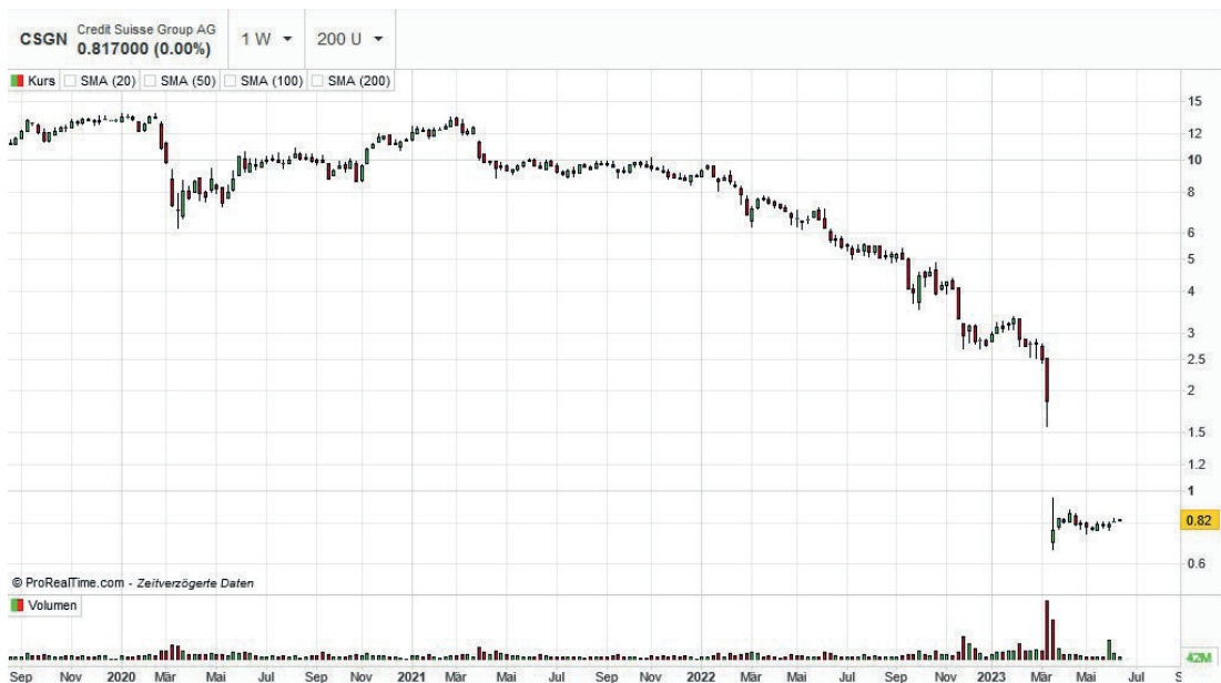
Aktienkurs der Credit Suisse - die (realistische) Einschätzung des Markts.

Auf den damit ausgelösten Absturz der CS-Aktien reagierten die FINMA und die SNB mit einer Medienmitteilung, wonach die CS «regulatorische Kapital- und Liquiditätsanforderungen» erfülle (FINMA, Medienmitteilung vom 15.03.2023: «FINMA und SNB nehmen Stellung zu Unsicherheiten am Markt»). Zu diesem Zeitpunkt waren staatliche Rettungsmassnahmen für die CS bereits angefallen (Art. 5 Abs. 3 BV als Verfassungsgrundsatz und Art. 9 BV als selbständig durchsetzbares Grundrecht verlangen von sämtlichen staatlichen Behörden ein Handeln nach Treu und Glauben).